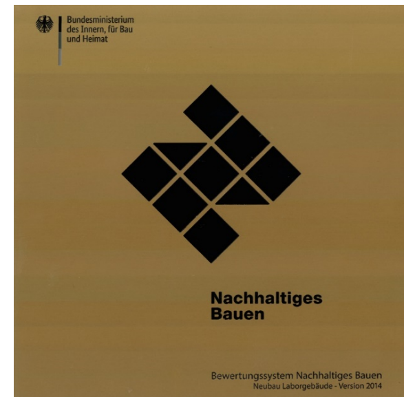
Plakette in Gold für nachhaltiges Bauen